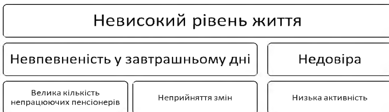
Рис. 2. Перепони на шляху впровадження накопичувальної системи пенсійного страхування