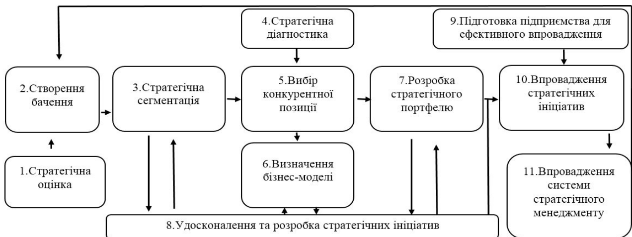
Рис. 3. Алгоритм розробки проактивної конкурентної стратегії

Доведено, що впровадження проактивної конкурентної стратегії хлібопекарським підприємством можливе за умови дотримання послідовності кроків: від стратегічної оцінки до реалізації системи стратегічного менеджменту (рис. 3).