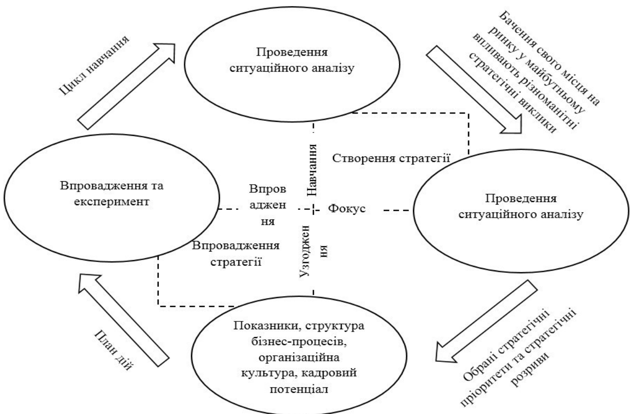
Рис. 4. Модель формування проактивної конкурентної стратегії

Визначено, що процес формування проактивної конкурентної стратегії хлібопекарним підприємством під впливом ринкової кон'юнктури можна поділити на два етапи: створення стратегії та виконання стратегії (рис. 4).