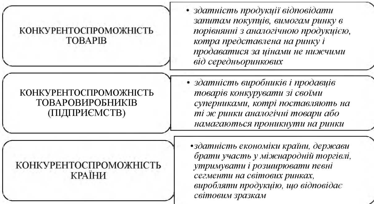
Рис. 1. Види конкурентоспроможності

Примітка. Побудовано автором на основі [1].