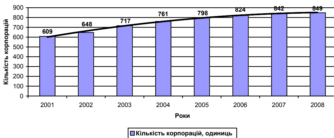
Рис. 2. Кількість корпорацій в Україні за період з 2001 по 2008 рр. (на основі офіційних даних Державного комітету статистики України)

Аналіз тенденцій розвитку корпорацій в Україні за період з 2001 по 2008 рр., показав їх зростання (рис. 2).