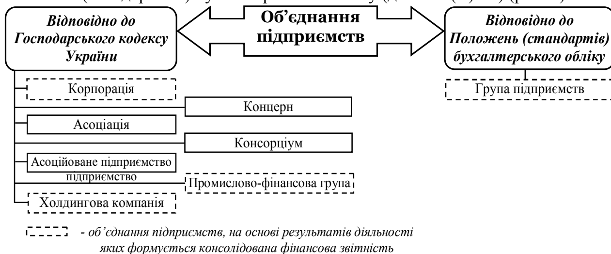
Рис. 1. Трактування видів об'єднань підприємств в законодавчих документах України

З метою ідентифікації видів об'єднань підприємств в Україні, на основі результатів діяльності яких повинна формуватись консолідована фінансова звітність, з'ясовано сутність поняття “об'єднання підприємств” та види об'єднань підприємств згідно з Господарським кодексом України (далі – ГКУ) та Положеннями (стандартами) бухгалтерського обліку (далі – П(С)БО) (рис. 1).