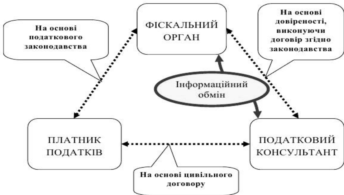
Рис. 3.2 Процес інформаційного обміну між фіскальними органами, платниками податків та податковими консультантами [85].

Сутність інформаційного обміну полягає в якісному наданні послуг податковими консультантами клієнтам. Клієнти в свою чергу, звертаються до фахівців для належного надання податкової документації в контролюючі органи, а також застерігають себе від переплати і недоплати податків. Податковий консультант покликаний виступати посередником між платником податків і фіскальними органами, як в суб'єктивному так і в об'єктивному плані, при цьому виконуючи свої основні функції. Всі три сторони взаємовідносин діють лише в межах чинного податкового законодавства [87].