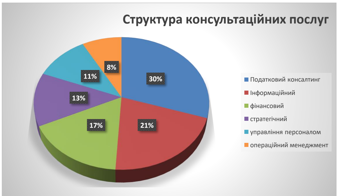
Рис. 2.1. Структура консультаційних послуг в системи запитів підприємств [29].

Прагнення підвищити прозорість, достовірність інформаційної підтримки прийняття рішень сьогодні, поряд з податковим консультуванням, значний попит на послуги інформаційного консалтингу, які в структурі ринку консалтингових послуг в Україні становлять 21 %. Разом з тим, з боку вітчизняних компаній простежується стійка тенденція зростання зацікавленості продуктами фінансового і стратегічного консультування, на які сьогодні припадає відповідно 17 % та 13 % загального ринку консультування. Прагнення підвищити свою продуктивність сприяло залученню вітчизняними підприємствами і компаніями консультантів з питань управління персоналом та операційного менеджменту (відповідно 11 % і 8 % в структурі консалтингових послуг) (див. рис.2.1.) [29].