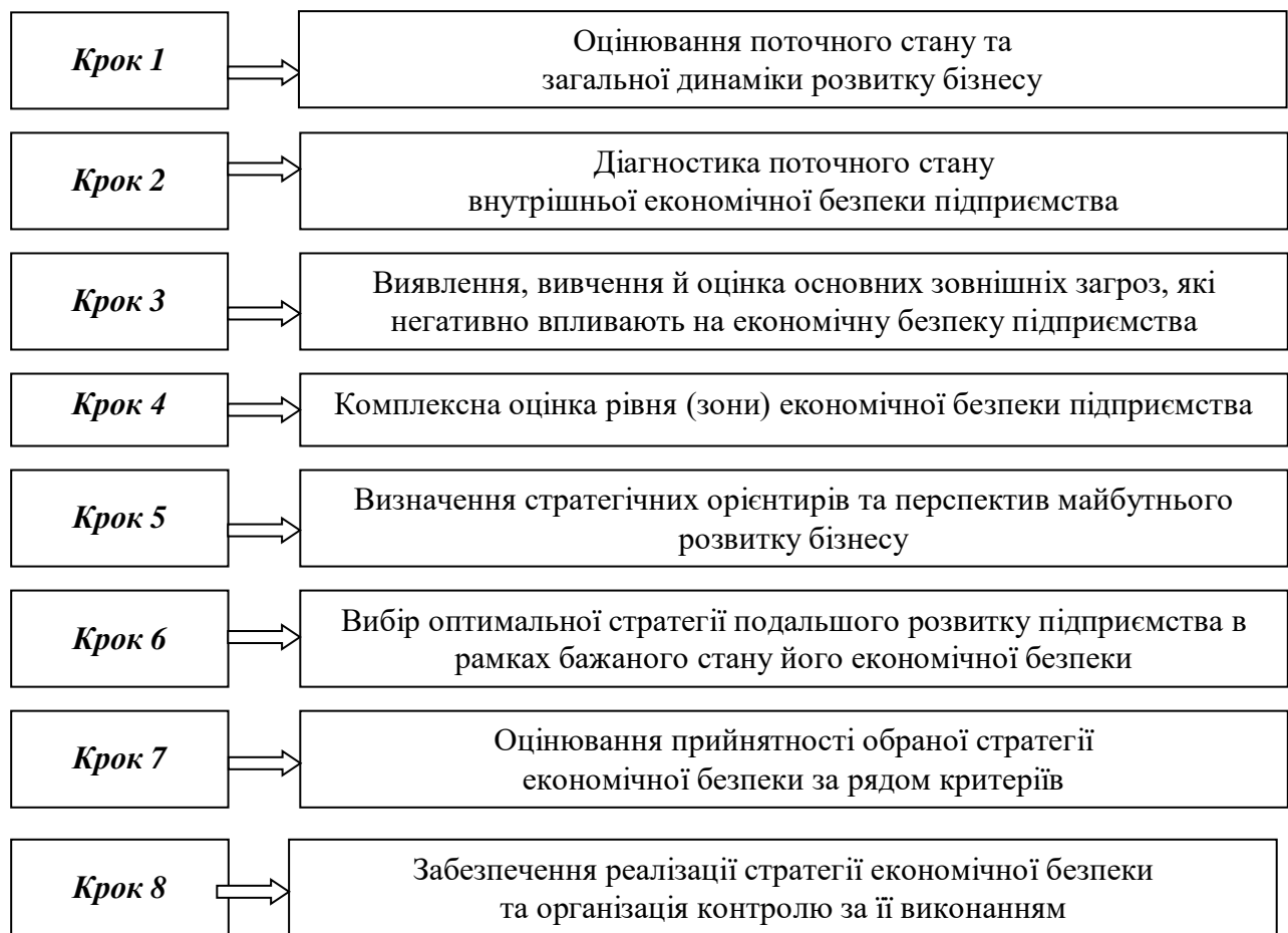
Рис. 1. Процес розробки стратегії економічної безпеки підприємства (розроблено авторами).

Процес формування стратегії економічної безпеки підприємства можна подати як сукупність взаємозв'язаних послідовних кроків (рис. 1).