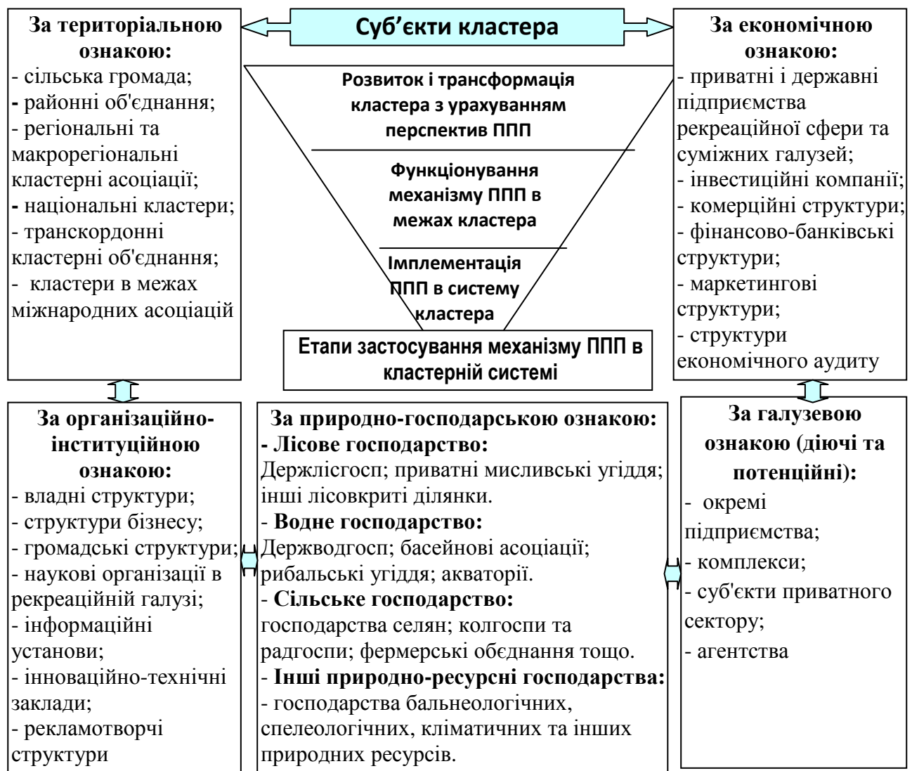
Рис. 1. Структура кластерного середовища для інституціонального забезпечення процесу запровадження та реалізації механізму публічно-приватного партнерства

Як всеохоплюючий проект, кластер є оптимальним інституціональним майданчиком для ефективної реалізації механізмів державно-приватного партнерства. В рамках кластера робиться акцент на підвищенні конкурентоспроможності як окремих підприємств, так і всього виробничого ланцюжка, включаючи постачальників, суміжників, дослідницькі та освітні організації. З іншого боку, участь держави в кластеризації виробництва є необхідною умовою її успішного здійснення. Державна участь в створенні кластера сприяє раціоналізації виробничо-ринкових процесів.