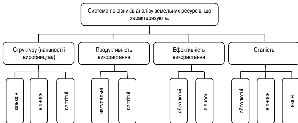
Рис. 2. Структура показників аналізу земельних ресурсів

На основі проведених досліджень та узагальнень було виявлено відсутність єдиного підходу щодо формування такої системи показників. В більшості наукових праць спостерігалось різне бачення не тільки набору показників і їх наповнення, але й їх різної класифікації та характеристики. Тому, на основі, опрацьованих джерел пропонуємо власну систему показників аналізу земельних ресурсів, сформовану за ознакою їх впливу на об'єкт дослідження (рис. 2). У більшості досліджених наукових праць спостерігалось різне бачення не тільки набору показників і їх наповнення, але й їх різної класифікації та характеристики.