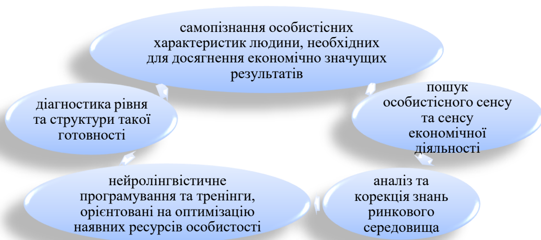
Рис. 2. Основні функції щодо формування психологічної готовності до економічної діяльності

Методика формування психологічної готовності до економічної діяльності передбачає реалізацію комплексу психологічних функцій, серед яких (рис.2):