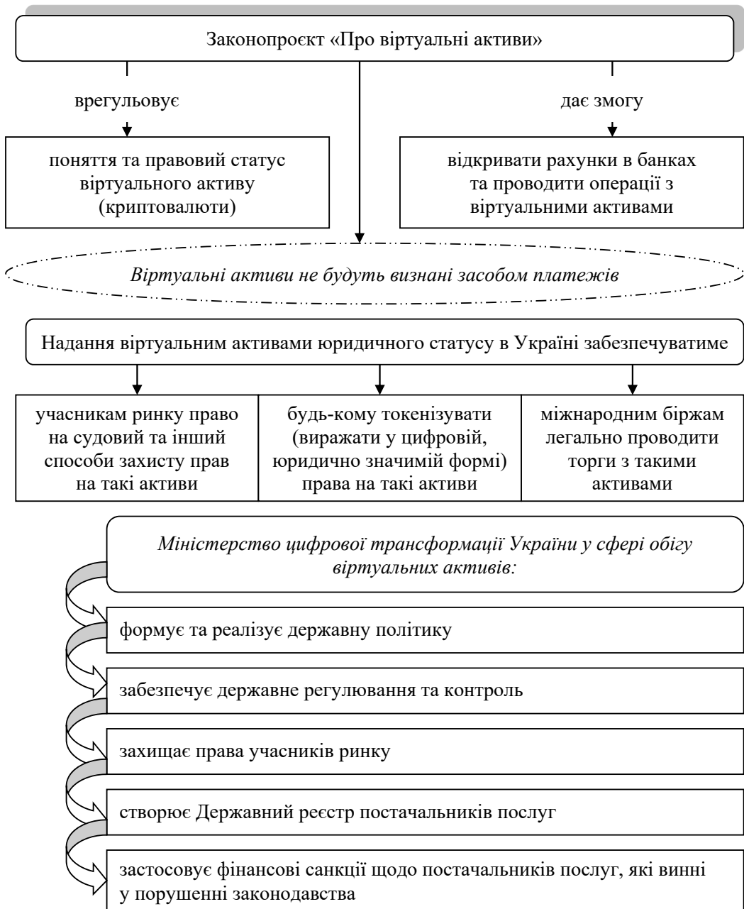
Рис. 3. Основні новації законопроекту “Про віртуальні активи”*