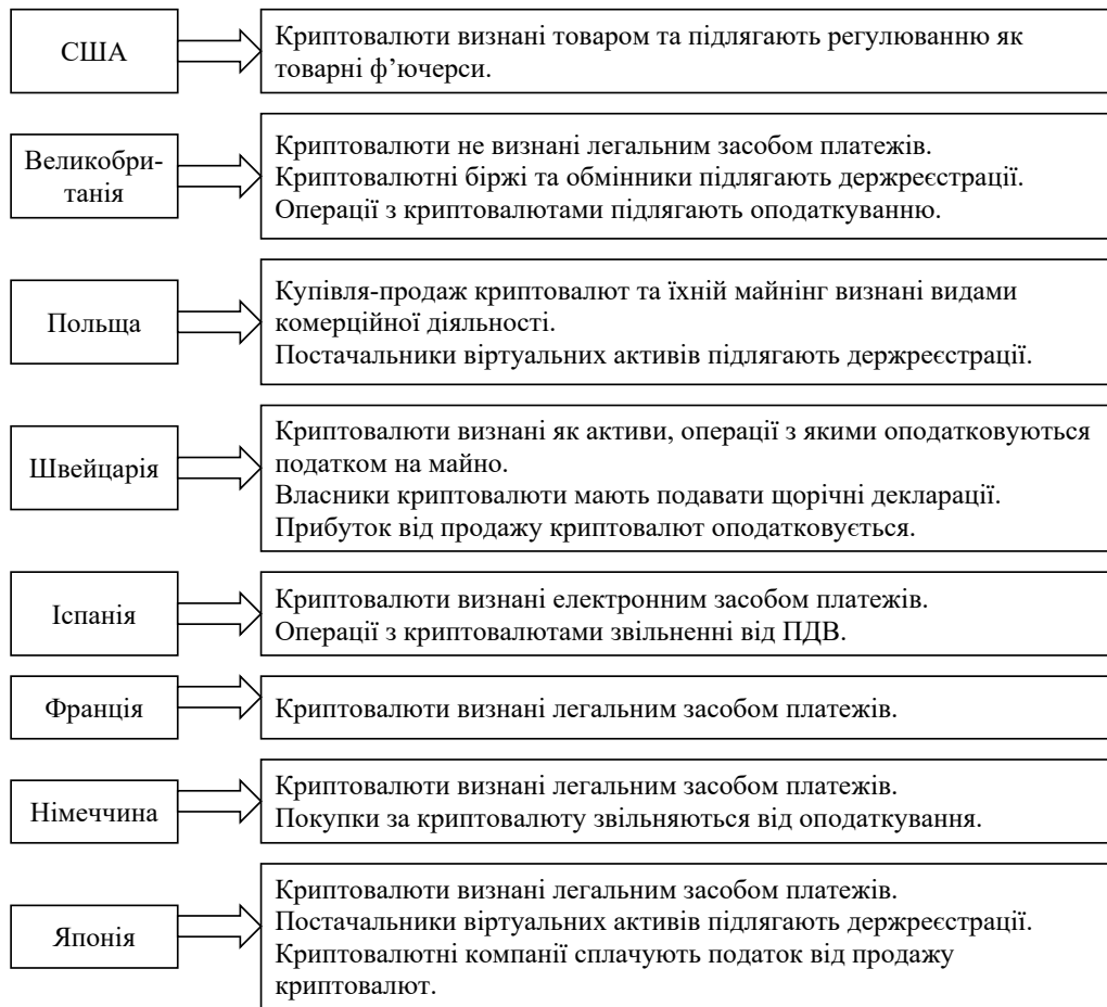
Рис. 2. Дотичність окремих країн до основних операцій із криптовалютами*