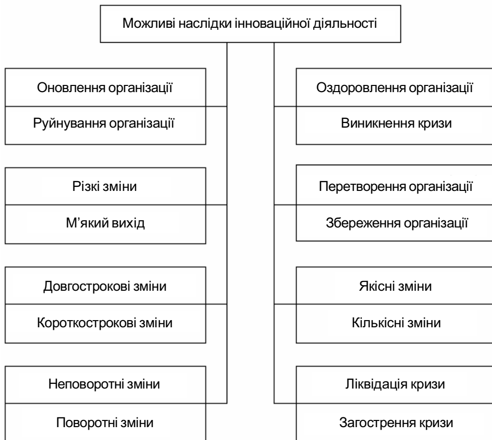
Рис. 3. Можливі наслідки інноваційної діяльності організації

Наслідки інноваційної діяльності визначаються не тільки її характером, ідейним наповненням та інтелектуальною сутністю, але й процесом організації й управління, що може поліпшувати або погіршувати одержання результату. У свою чергу, можливості управління значною мірою залежать від мети, професіоналізму, мистецтва управління, характеру мотивації, розуміння причин та наслідків, рівня відповідальності керівників і виконавців (рис. 3).