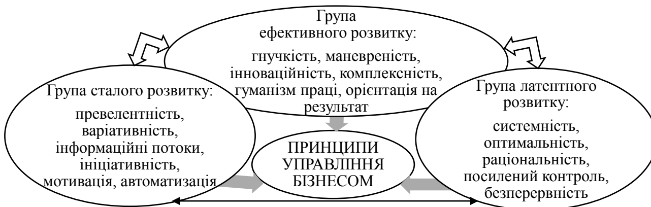
Рис. 1. Принципи управління бізнесом за групами його розвитку

Крім авторських визначень функцій управління (планування, прогнозування, організаційної, координаційної, мотивації, контролю, регулювання), додатково виділено функцію інноваційного та гнучкого розвитку, яка базується на застосуванні методів гнучкого управління бізнес-процесами, інноваційного та нестандартного мислення учасників бізнесу, командній роботі, поетапному контролю і рефакторингу результатів. Функцій управління згруповано за рівнем здійснення: вищої ланки, середньої ланки, «прямого виробництва», змішаного типу. Принципи управління згруповано за їх впливом на бізнес (рис. 1).