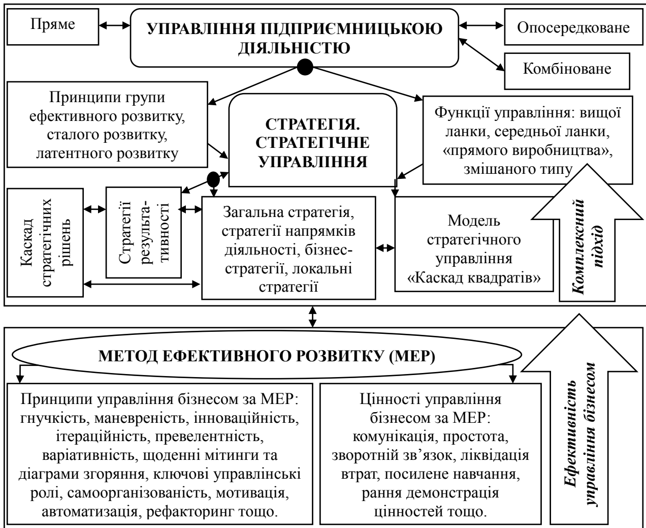
Рис. 3. «Метод ефективного розвитку» в управлінні бізнесом

власним бізнесом будь-якої організаційно-правової форми, напряму діяльності, величини, розроблено модель «Метод ефективного розвитку» (рис. 3).