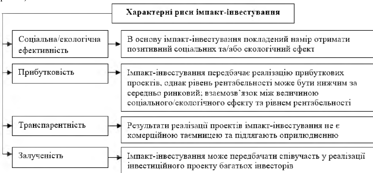
Рис. 1. Характерні особливості імпакт-інвестування

Прибутковість є однією із характеристик імпаکت-інвестицій, але вона може значно варіюватись. Для багатьох проектів імпакт-інвестування рентабельність є нижчою за середньоринкову, що обумовлюється такими можливими причинами: по-перше, специфікою цінової політики, що передбачає встановлення пільгових цін на продукovanі товари/послуги для певних категорій споживачів; по-друге, обмеженням рівня прибутковості виробництва для забезпечення доступності товарів/послуг для широкого кола споживачів; по-третє, відрахуванням частини прибутку на соціальні/екологічні заходи. Втім, прибутковість імпакт-інвестицій може навіть перевищувати середньоринкові показники, однак в її основі має лежати тісний зв'язок між рентабельністю та величиною соціального/екологічного ефекту (рис. 1).