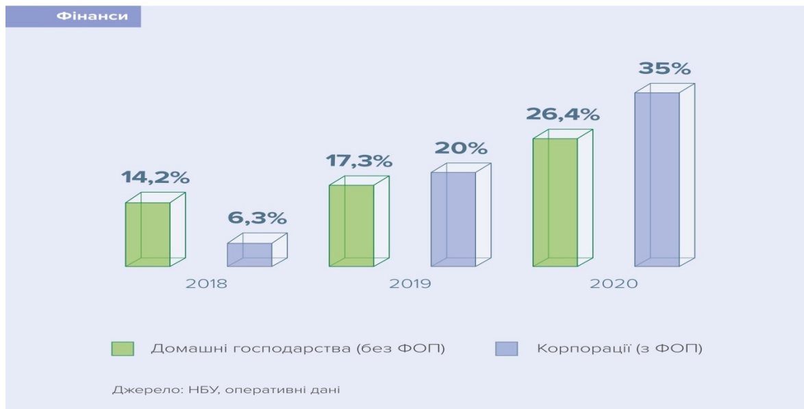
Рис. 1. Динаміка приросту гривневих депозитів населення та підприємств України у 2018-2020 роках [1]

Помітною тенденцією на ринку банківських депозитних послуг стало зменшення вартості депозитів. Для населення у гривні вони зменшилися на 6 в. п. (до 8% річних). У валюті ставки впали на 1,2 в. п. і для домогосподарств становили 1,2% річних (рис. 2).