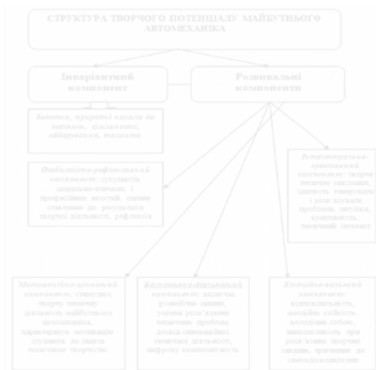
Рис. 2. Структура творчого потенціалу майбутнього автомеханіка

ВИСНОВКИ. Послугуючись правилами визначення понять, уточнено дефініцію поняття «творчий потенціал майбутнього автомеханіка» як інтегративну властивість особистості, що дає змогу успішно здійснювати творчу професійну діяльність. Запропоновано розглядати даний феномен як синтез інваріантного і варіативного складників. Обґрунтовано, що цей складний особистісний конструкт поєднує мотиваційно-ціннісний, інтелектуально-креативний, когнітивно-діяльнісний, емоційно-вольовий та особистісно-рефлексивний компоненти. Перспективи подальших наукових розвідок пов'язуємо з обґрунтуванням педагогічних умов цілеспрямованого розвитку творчого потенціалу майбутнього автомеханіка в коледжі.