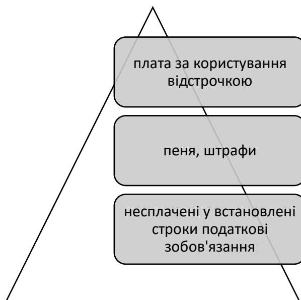
Рис.1 Склад податкового боргу

Склад податкового боргу відображено на рис.1