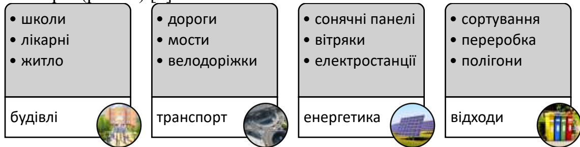
Рис.1. Інфраструктура громади

Громадська інфраструктура охоплює інфраструктурні об'єкти, системи, структури та споруди, які належать і управляються громадськістю (тобто органами місцевого самоврядування на рівні ОТГ або урядом на державному) та які відкриті для загального користування. Громадська інфраструктура є досить різноманітним сектором. У будь-якій ОТГ вона може охоплювати всі або деякі з таких секторів (рис. 1.) [2]