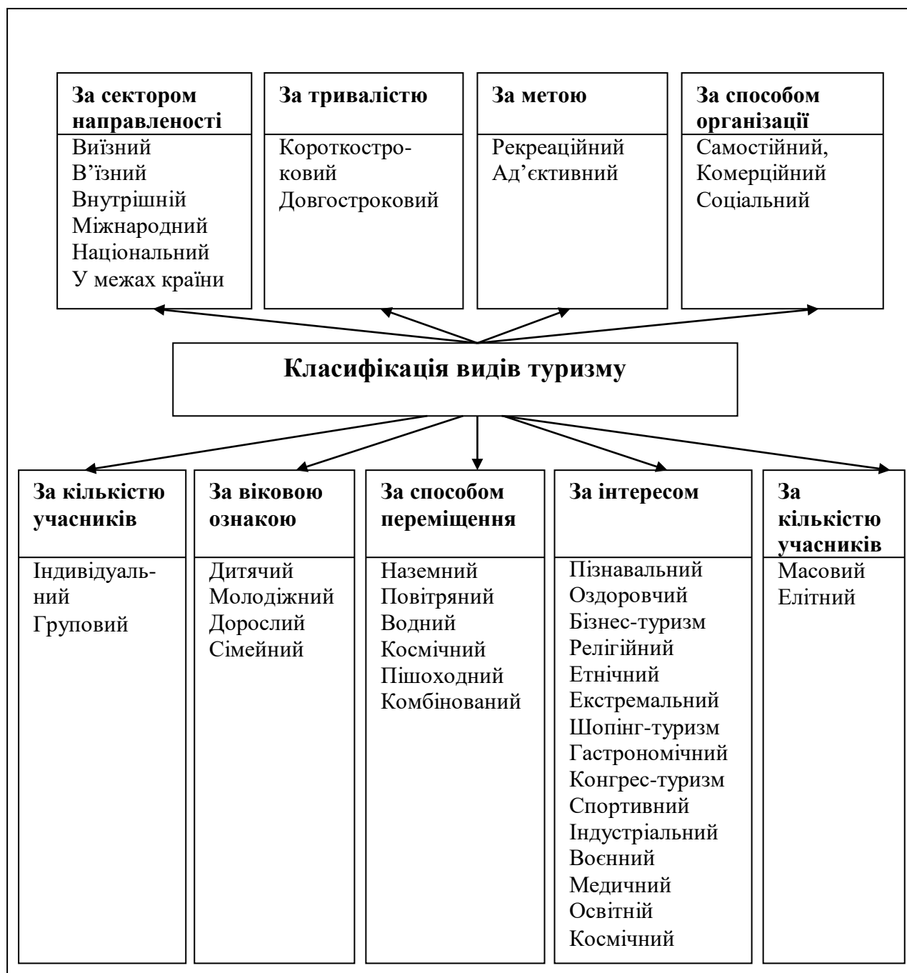
Рис. 1.2. Класифікація видів туризму

характером (духовні, комерційні); за способом оплати (платні, соціальні); за територією (локальні, регіональні, міжнародні); за спеціалізацією (освітні, юридичні, фінансові, туристичні, транспортні, страхування, культурні, розміщення, харчування, рекреації та ін.); за формою організації (державні, приватні); за тривалістю (безстрокові, строкові); за частотою (разові, періодичні); за сегментом (стандартні, елітні); за способом надання (мобільні, стаціонарні).» [9; с.21]