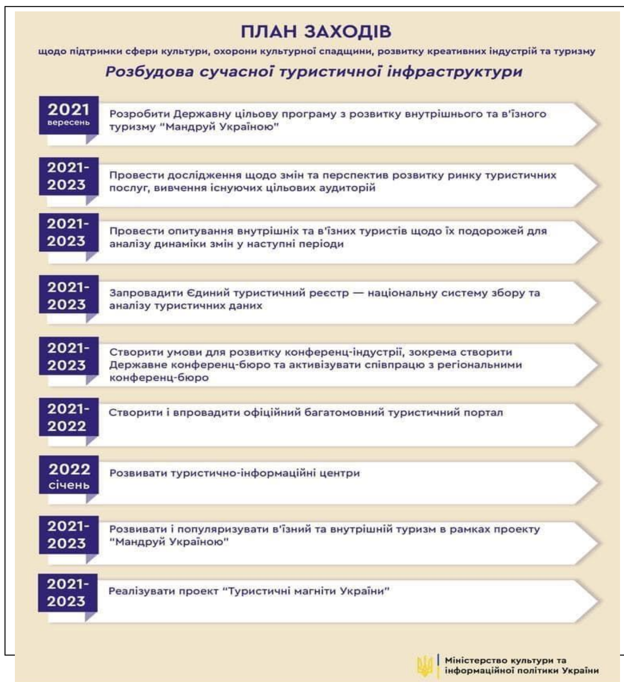
Рис. 3.1. «План Заходів» щодо підтримки сфери культури, охорони культурної спадщини, розвитку креативних індустрій та туризму.

Варто зазначити, що Міністерство культури та інформаційної політики України розробило на 2022 -2023 рр. «План Заходів» щодо підтримки сфери культури, охорони культурної спадщини, розвитку креативних індустрій та туризму. В Україні розпочато розбудову сучасної туристичної інфраструктури (рис. 3.1.) [55].