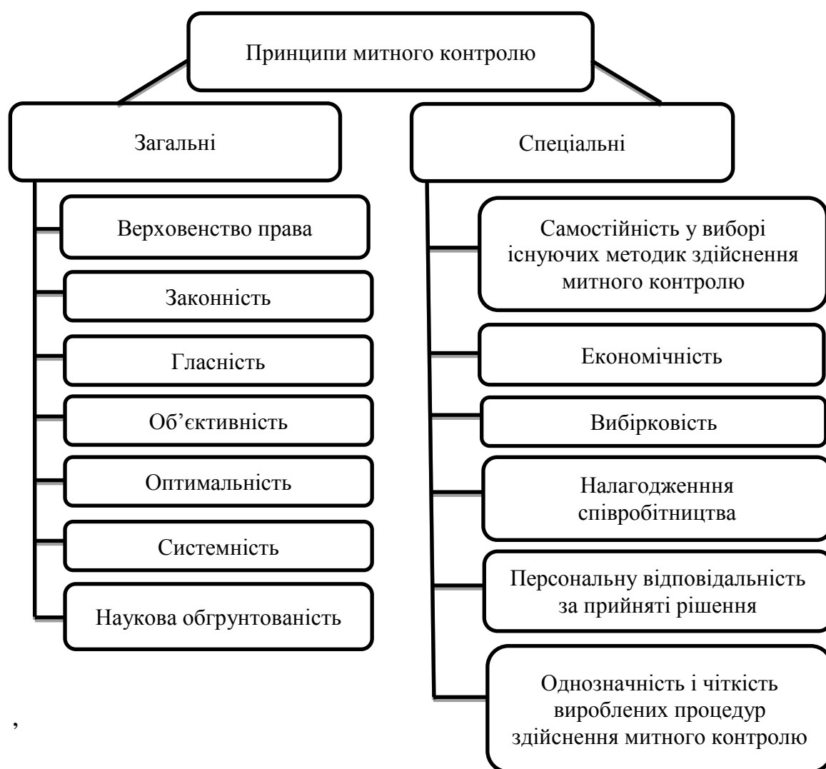
Рис. 1.3. Принципи митного контролю [17].

Інституційне забезпечення митного контролю відображене у Митному кодексі України, міжнародно-правових актах, які були укладені Україною у письмовій формі з іноземними державами або іншими суб'єктами міжнародного права із питань, що мають пряме або дотичне значення до процедури здійснення митного контролю в Україні, законодавчих і нормативно-правових актах, а також наказах Державної фіскальної служби України, які передбачають організацію митного контролю у вигляді технологічних схем, порядків положень і правил, які визначають правову основу та послідовність дій посадових осіб митних органів [34].