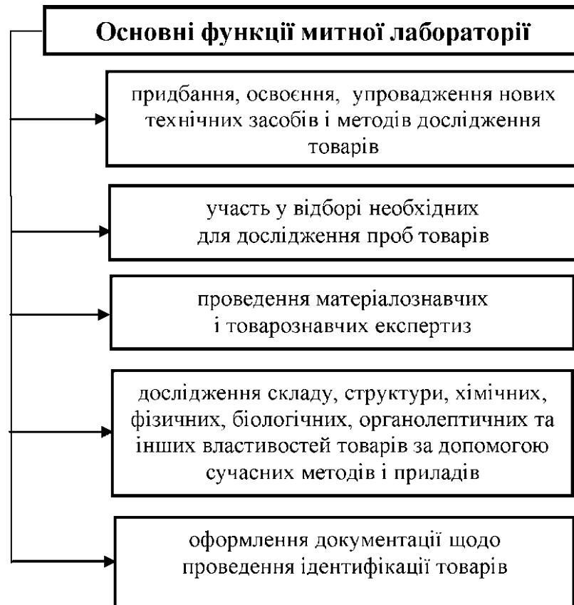
Рис. 2.2. Основні функції митної лабораторії

З метою ідентифікації товарів та розмитнення відповідної документації митні органи мають право відбирати зразки товарів для дослідження в митній лабораторії.(рис. 2.2 та рис. 2.3).