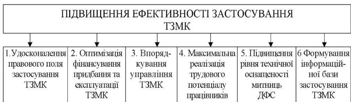
Рис. 3.1. Декомпозиція цілі «підвищення ефективності застосування технічних засобів під час здійснення митного контролю»

Ми пропонуємо розбити загальну мету - підвищення ефективності застосування ТЗМК (рис. 3.1).