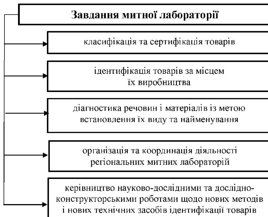
Рис. 2.3. Основні завдання митної лабораторії

Класифікація та значення характеристик технічних засобів митного контролю є такими (див рис. 2.4 та Додаток 3).