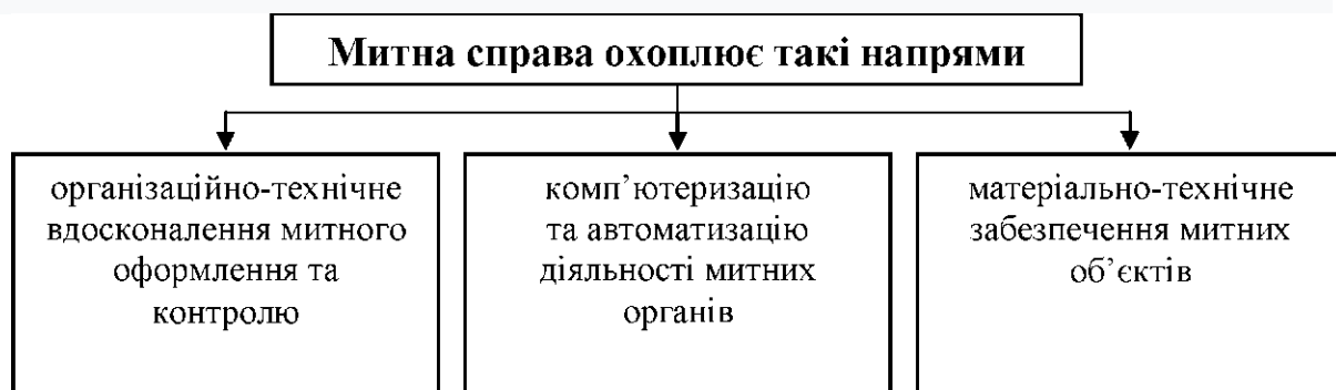
Рис. 2.1. Напрями забезпечення митної справи

Зі зростанням ролі у регулюванні зовнішньоекономічної діяльності України набуває значення подальший розвиток митниці(рис. 2.1).