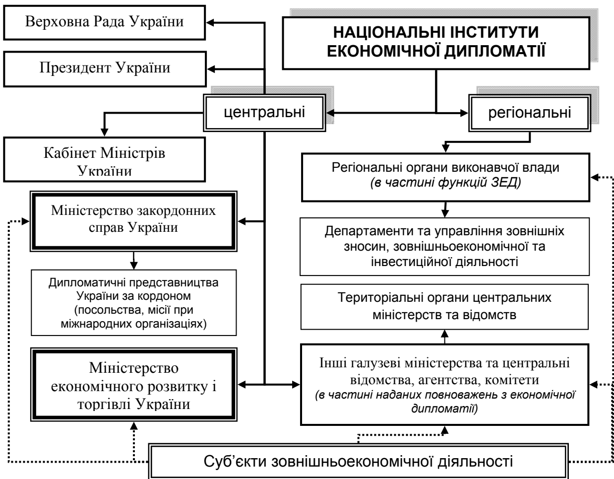
Рис. 2. Механізм взаємодії національних інститутів економічної дипломатії України (розроблено автором)

Доведено, що важливим аспектом в механізмі економічної дипломатії є роль держави, оскільки суб'єкти господарювання мають можливість виступати реальним актором економічної дипломатії лише на її макрорівні, так як її мезо- і, тим більше, макрорівень знаходяться в полі можливого впливу суто держави, а якісне наповнення економічної дипломатії може набувати істотних відмінностей залежно від країни (рис. 2). При цьому реалізація економічної дипломатії України повинна забезпечуватись, з одного боку, інститутами законодавчої влади, центральними та регіональними органами виконавчої влади, з іншого – безпосередньо суб'єктами ЗЕД, які є експортерами та імпортерами продукції і послуг, партнерами в інвестиційному співробітництві та кооперації.