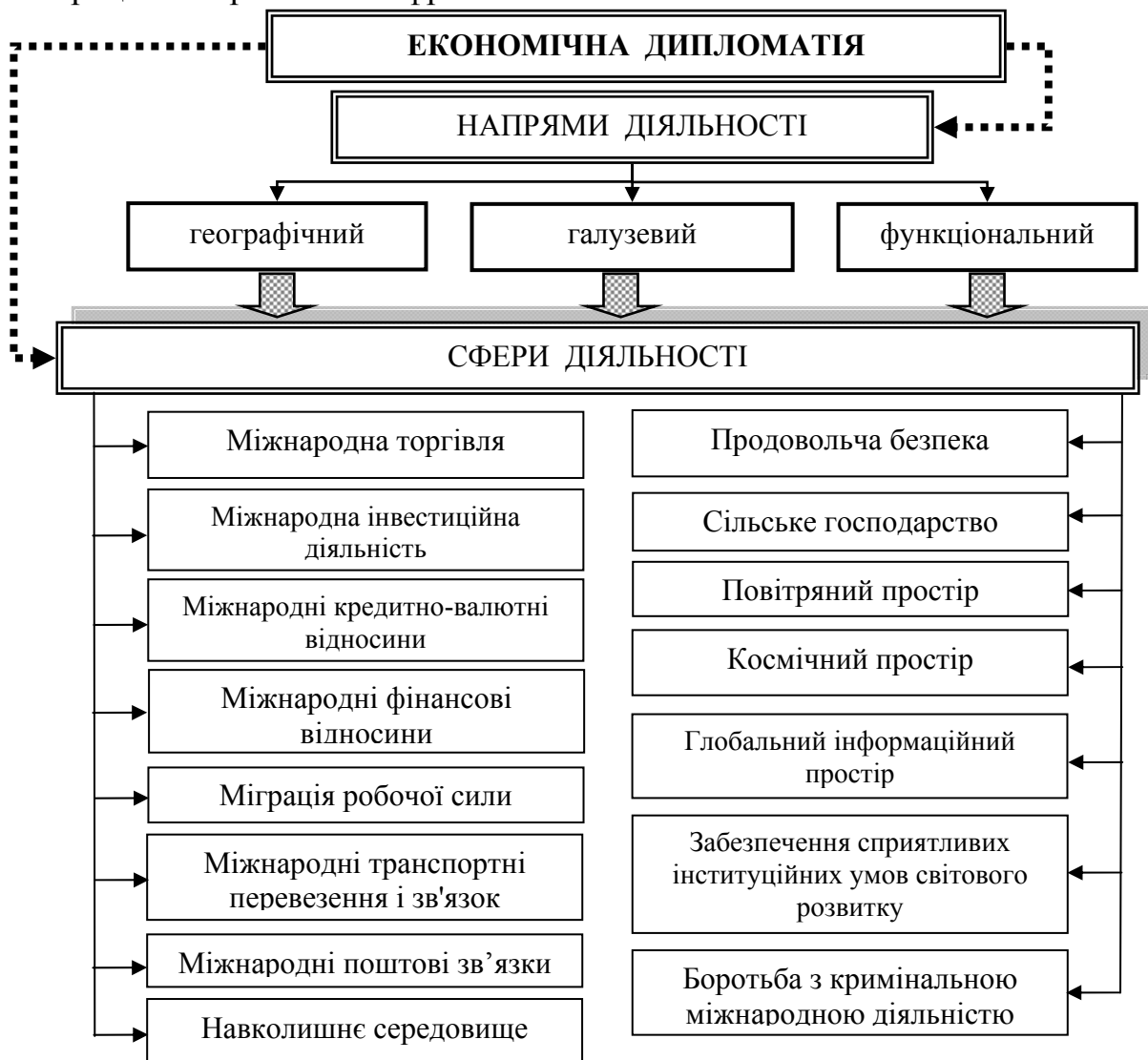
Рис. 3. Напрями і сфери функціонування механізму економічної дипломатії (розроблено автором)

У третьому розділі «Диверсифікація функціональної структури механізму економічної дипломатії України» досліджено і визначено, що інтереси економічної дипломатії формуються в залежності від досягнутих результатів експортно-імпоротної діяльності України як у взаємодії з країнами-партнерами чи інтеграційними угрупованнями, так і з орієнтацією виходу на нові стратегічні цілі щодо завоювання нових ніш і освоєння нових сегментів на міжнародних ринках (рис. 3). Пріоритетним напрямом для економічної дипломатії тут є вектор ЄС Серед інших векторів економічної дипломатії в географічному напрямі слід звернути увагу на співробітництво з країнами Азії і, в першу чергу, з Китаєм, Індією, Туреччиною, Іраном. Перспективними, але на даний час недостатньо ефективними, є напрями співпраці з Америкою та Африкою.