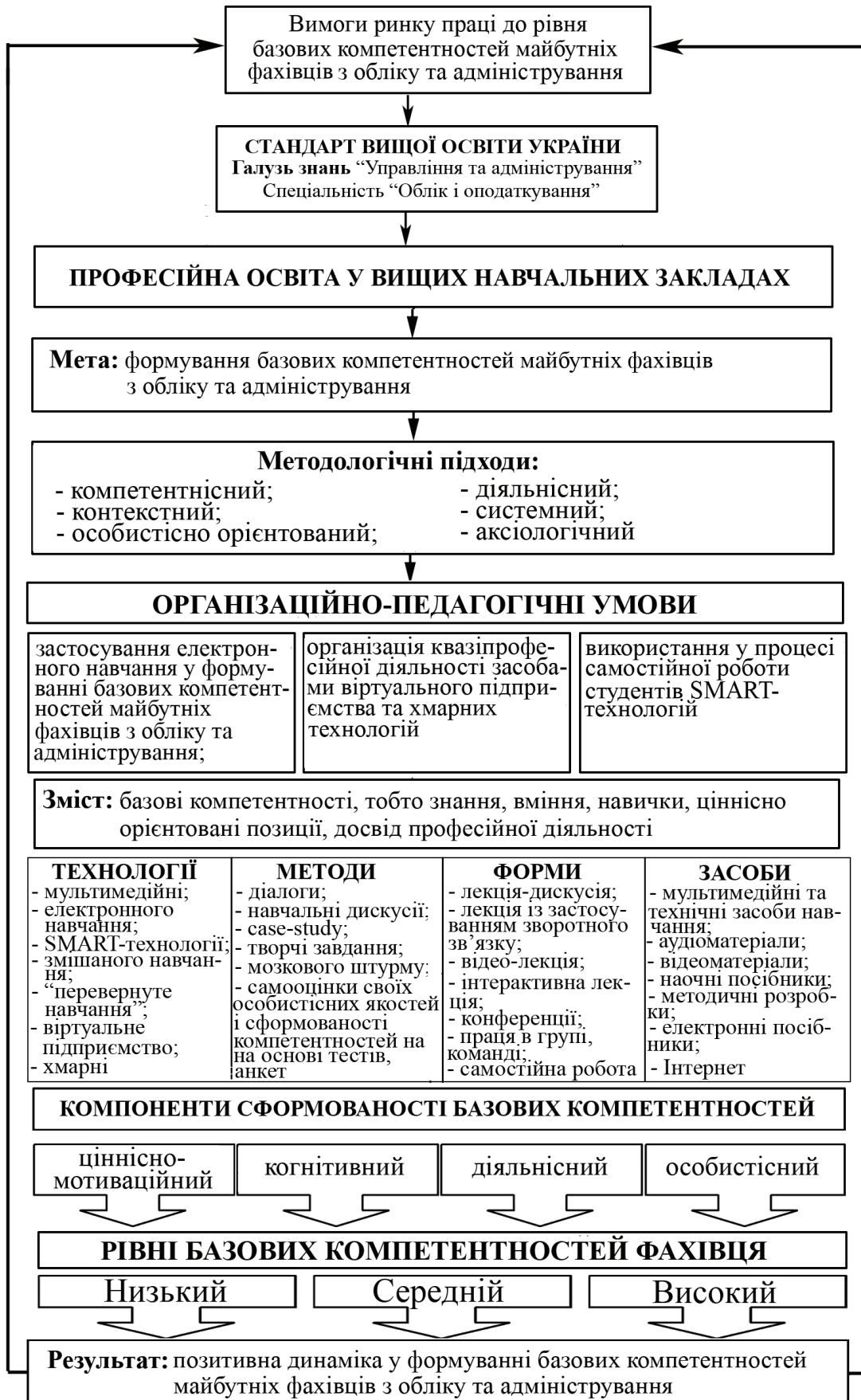
Рис. 1. Модель формування базових компетентностей майбутніх фахівців з обліку та адміністрування в процесі професійної підготовки