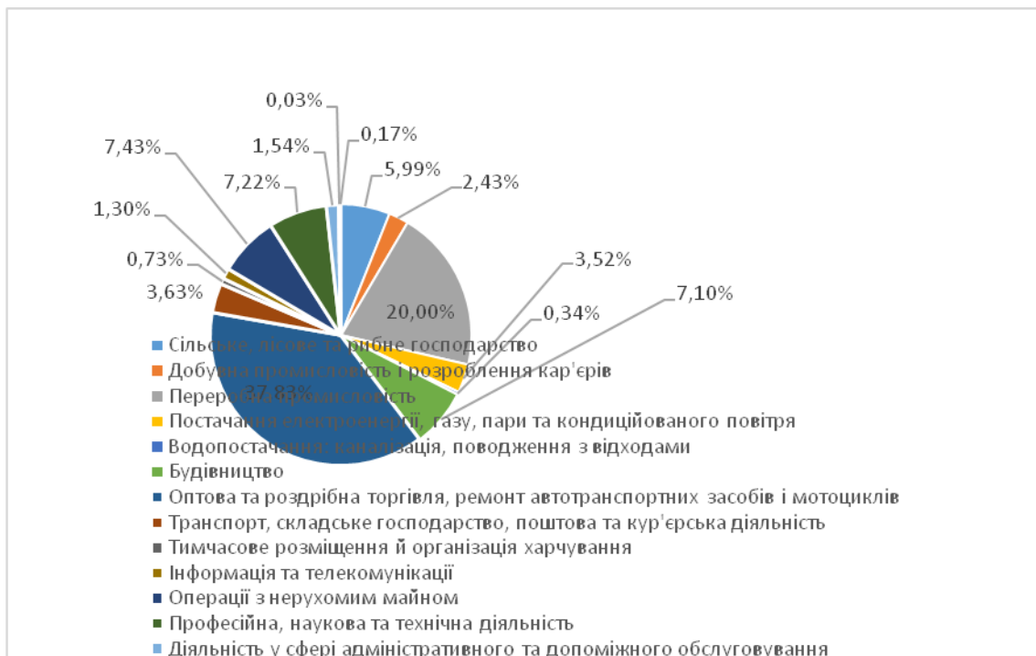
Рис. 2. Структура банківських кредитів за видами економічної діяльності станом на кінець 2014 року

Найбільша частка кредитів зосереджена в оптовій та роздрібній торгівлі, ремонту автотранспортних засобів і мотоциклів та складає 37,83% загального обсягу кредитів (рис. 2).