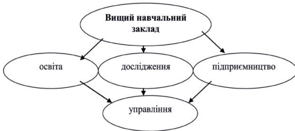
Рис.2. 3. Основні складові діючого вищого навчального закладу

Здійснення даної моделі вимагає від вищого навчального закладу факту інноваційної інфраструктури. Зараз ж кінцева в нашій країні перебуває на низькому рівні. По-перше, це спричинено обмеженістю державного фінансування. Так, при нормі 1,7% фінансування інноваційної діяльності являє 0,4%.