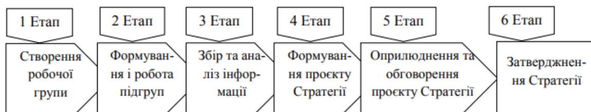
Рис. 3.1. Організація процесу розробки та затвердження проєкту.

Початковим етапом розробки проєкту Стратегії розвитку вищої освіти в Україні на 2021–2031 роки є формування та утверджено наказом т.в.о. міністра освіти і науки України робочої групи. Відповідно до Наказу від 28 липня 2020 року № 974 «Про утворення робочої групи з розроблення проєкту Стратегії розвитку вищої освіти України на 2021–2031 роки » було створено і затверджено робочу групу у складі 102 особи.