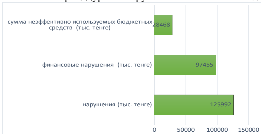
Рис.1. Сумма средств, охваченных государственным аудитом

20 ноября 2020 года подведены итоги государственного аудита развития местного самоуправления, оценки четвертого уровня бюджета и использования бюджетных средств и передачи государственного имущества в доверительное управление, реализации антикризисных мер, то есть по расходам местного бюджета. Сумма средств, охваченных государственным аудитом, составляет 3 367 691,0 тыс. тенге. По результатам проверки выявлены нарушения на сумму 125 922,3 тыс. Тенге. В том числе финансовые нарушения 97 455,2 тыс. тенге, сумма неэффективно используемых бюджетных средств – 28 467,1 тыс. Тенге. Кроме того, количество процедурных нарушений составляет 79 единиц.