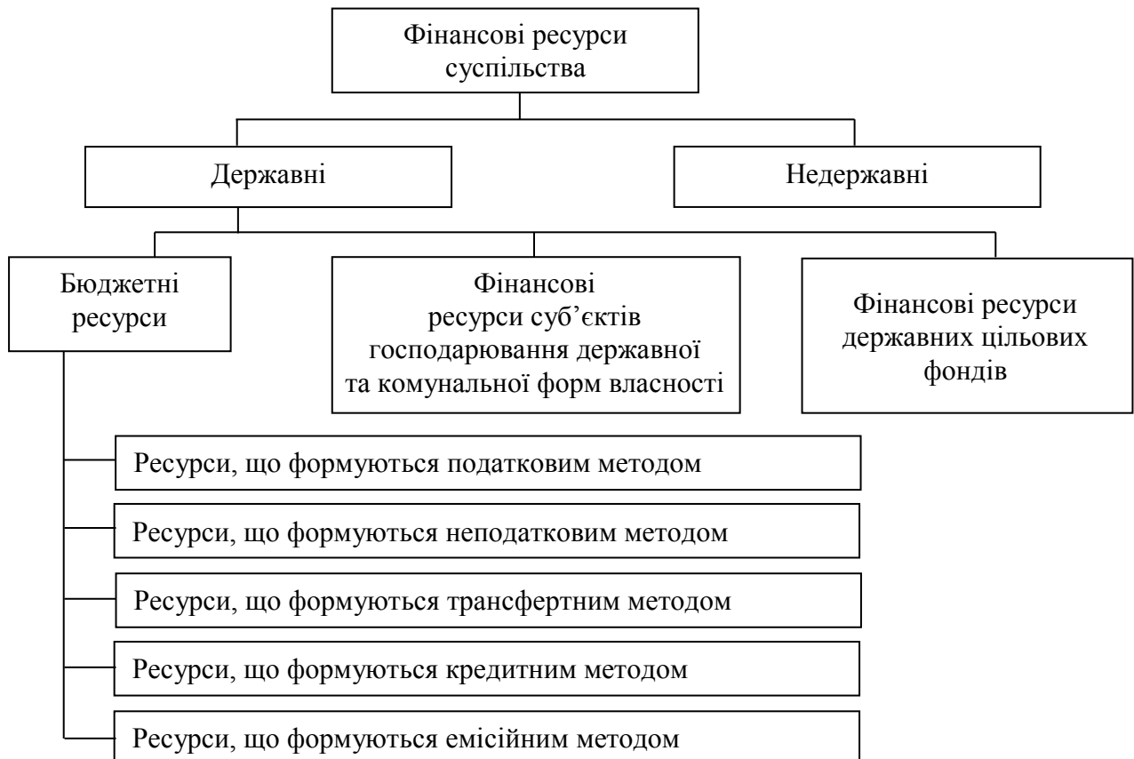
Рис. 1. Місце бюджетних ресурсів у фінансових ресурсах суспільства

Визначено місце бюджетних ресурсів у фінансових ресурсах суспільства (рис. 1).