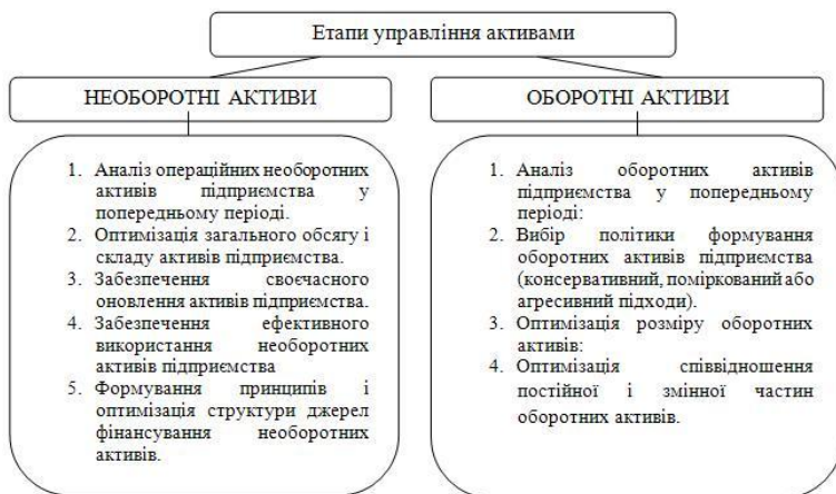
Рис. 2. Етапи управління активами [2,3]

Формування та реалізація ефективно діючої системи управління активами залежить від правильної побудови її логічної послідовності. Послідовність реалізації політики з управління активами відображається у її ключових етапах (рис. 2.) В рамках аналізу оборотних активів у попередньому періоді доцільним є дослідження динаміки їх загального обсягу, складу, їх оборотності та рентабельності, а також джерел фінансування. Оптимізація розміру оборотних активів, у свою чергу включає визначення системи заходів з реалізації резервів, перегляд й коректування обсягу та частки окремих видів активів та визначення їх планового обсягу на майбутній період.