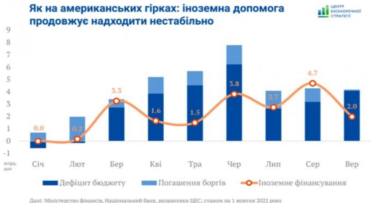
Рис. 3. Динаміка дефіциту бюджету, погашення боргів та іноземного фінансування в Україну січні-вересні 2022 року [2]

Водночас «надходження іноземної допомоги у вересні впали більш, ніж удвічі, порівняно з 4,7 млрд дол. у серпні» [2] (рис. 3).