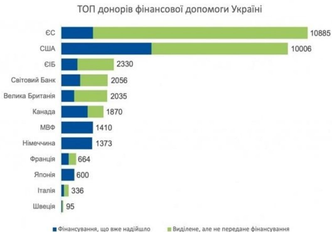
Рис. 1. ТОП донорів фінансової допомоги Україні станом на 1 серпня 2022 року [3]

У сучасних умовах повномасштабної війни РФ проти України питання погашення зовнішніх боргів для нашої держави стали надзвичайно актуальними. Це і не дивно, адже лише за січень-червень 2022 року Державний бюджет України виконано з дефіцитом у розмірі 405,2 млрд грн (або 13,9 млрд дол. США). Відтак з метою подолання негативних наслідків збройної агресії РФ проти України, іноземні партнери надають нашій державі величезну фінансову допомогу (станом на 1 серпня 2022 року її обсяги становили 12,7 млрд дол.). Нині «найбільшими фінансовими донорами України є Євросоюз та Сполучені Штати, які разом пообіцяли Україні надати фінансову підтримку на понад 10 млрд дол. кожен. Водночас з боку США допомога є на 90% грантовою, а обіцяні кошти ЄС – кредитними, хоч і за пільговими умовами» [3] (рис. 1).