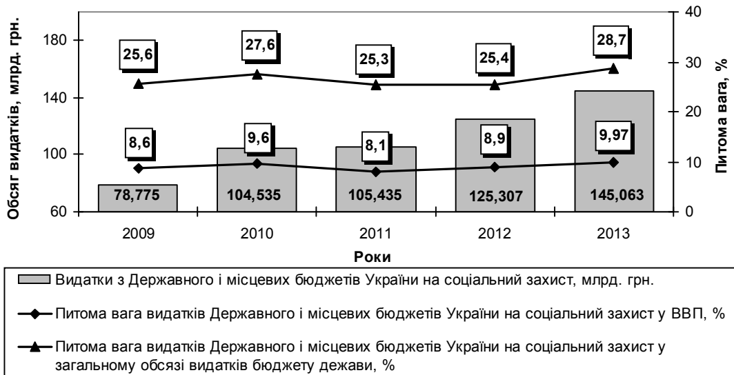
Рис. 1. Динаміка бюджетного забезпечення соціального захисту в Україні у 2009–2013 рр.

вирішення основних соціальних проблем та підтверджує тезу про соціальну спрямованість бюджетної політики держави. Водночас використання цього соціально-економічного інструменту має бути вкрай виваженим, прогнозованим і науково обґрунтованим.