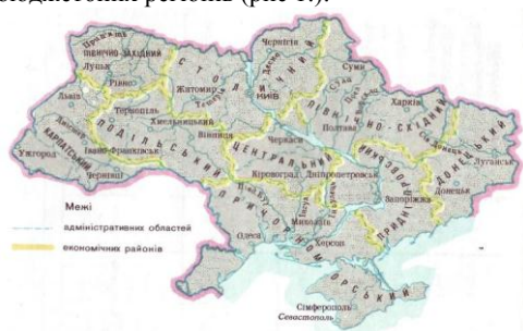
Рис. 1. Фіскально-бюджетні регіони в Україні

Зважаючи на вищевказані чинники на території України можна виділити дев'ять фіскально-бюджетних регіонів (рис 1.):