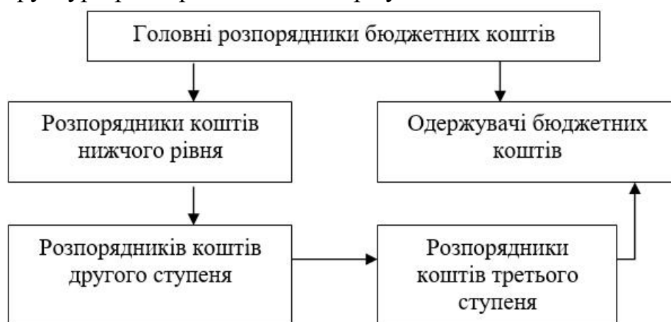
Рис. 1. Взаємозв'язок та підпорядкованість розпорядників та одержувачів бюджетних коштів

Однак система закладів культури та туризму потребує поглибленого вивчення з метою надання пропозицій щодо її удосконалення. Враховуючи значну частину у структурі джерел фінансування бюджетних джерел, слід розглянути систему закладів, які фінансуються за рахунок бюджетних коштів в контексті структури розпорядників та одержувачів бюджетних коштів (рис. 1).