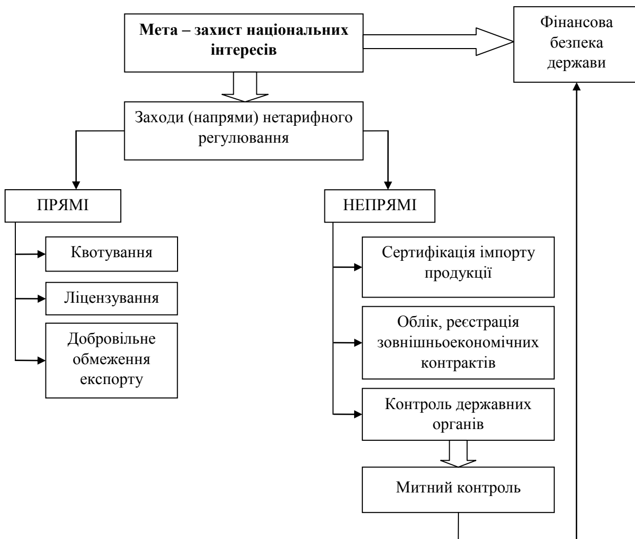
Рис. 1.2. Митний контроль як напрям нетарифного державного регулювання

«Федоткін В. також досліджує митний контроль як одну з основних систем митного регулювання зовнішньоекономічних відносин та в цілому митної справи» [41, с. 60]. Група вчених під керівництвом Ю.В. Соловков визначає сутність митного контролю переліком методів і прийомів здійснення митного контролю, що спрямовані на конкретні об'єкти. Незважаючи на цінність проведеного авторами дослідження, при цьому митний контроль не розглядався як вид фінансового контролю, зосереджуючись виключно при експорті, ветеринарному, фітосанітарному, санітарно-епідеміологічному та інших видах державного контролю. Науковий підхід до митного контролю, орієнтований на вивчення методів (методів і прийомів) митного регулювання, можна визначити як