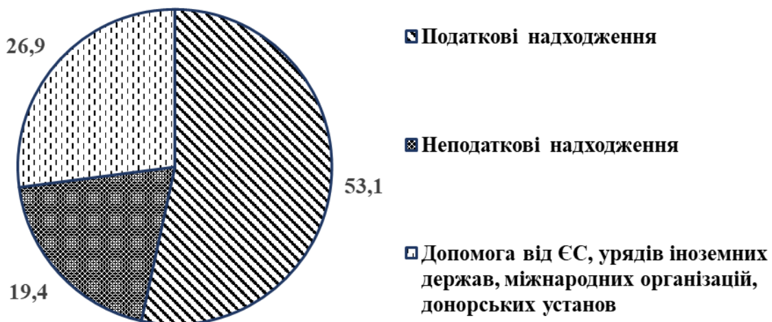
Рис. 2. Питома вага надходжень в доходах Державного бюджету України в 2022 році, %

За період з 2018 по 2022 роки, найбільше надходжень від міжнародних установ та організацій простежується саме в 2022 році, і це зрозуміло, адже, насамперед, завдячуючи допомозі міжнародних партнерів, доходну частину бюджету було виконано на прийнятному рівні. Отже, у 2022 році «найбільшу питому вагу в загальному обсязі надходжень до Державного бюджету України становили податкові надходження 53,1%, неподаткові надходження – 19,4% від загальної суми доходів державного бюджету і 26,9% – допомога від ЄС, урядів іноземних держав, міжнародних організацій, донорських установ» (рис. 2) [7].