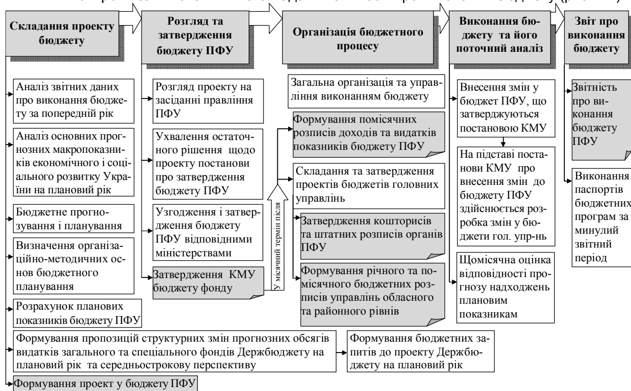
Рис. 1.2. Основні етапи бюджетного процесу Пенсійного фонду