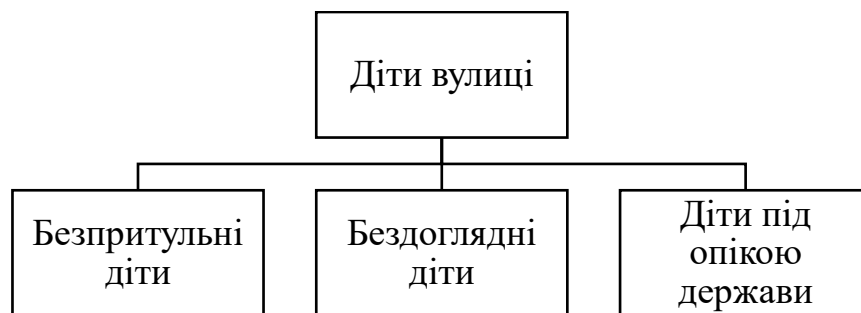
Рис. 1.3 – Категорії дітей вулиці

Відповідно до документів Дитячого Фонду Об'єднаних Націй (ЮНІСЕФ), діти вулиці можуть бути розділені на кілька категорій [15 ] (рис.1.3):