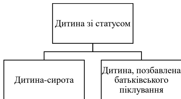
Рис. 1.1 – Діти зі статусом, згідно чинного законодавства України