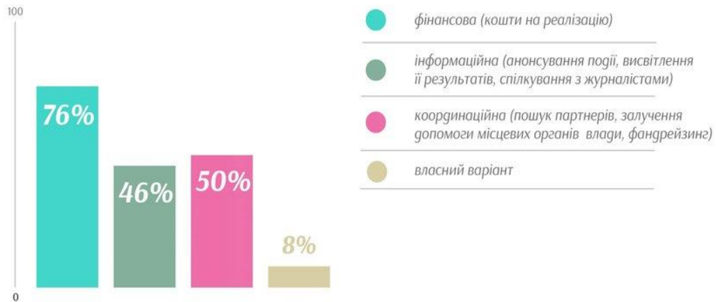
Рис. 3. Очікувана культурно-мистецькою спільнотою України допомога в умовах повномасштабної війни [2]

Проте зазначимо, що для того, аби вітчизняна галузь культури і мистецтва успішно розвивалася, монетизовувалася і наповнювала бюджет, необхідно мінімізувати вплив бюрократичної системи на галузь та збільшити її диджиталізацію, котра залишає значно менше шансів для проявів корупції.