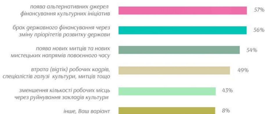
Рис. 2. Очікувані українською культурною спільнотою наслідки повномасштабної війни для галузі [2]

При цьому слід акцентувати, що культурно-мистецька спільнота України потребує гостро потребує не лише фінансової (76% респондентів), але й координаційної (50% респондентів) та інформаційної (46% респондентів) підтримки (рис. 3).