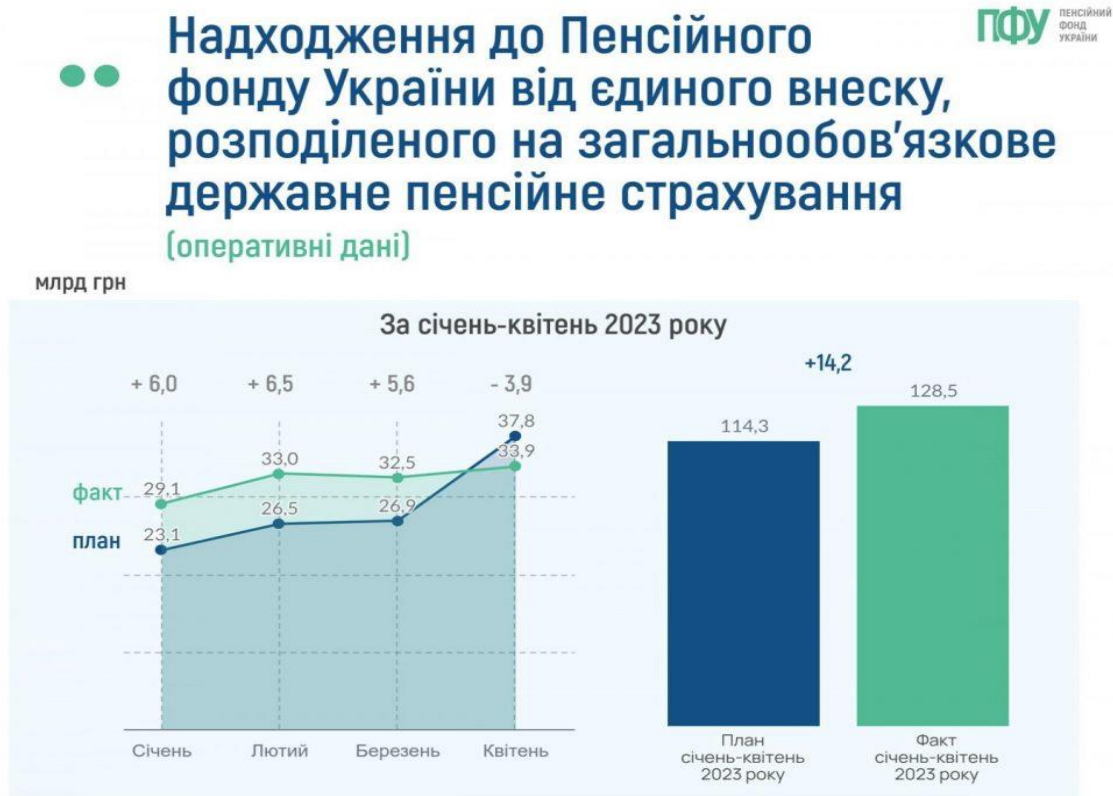
Рис. 3. Динаміка надходжень до Пенсійного фонду України від єдиного внеску, розподіленого на загальнообов'язкове державне пенсійне страхування, у січні – квітні 2023 року [3]