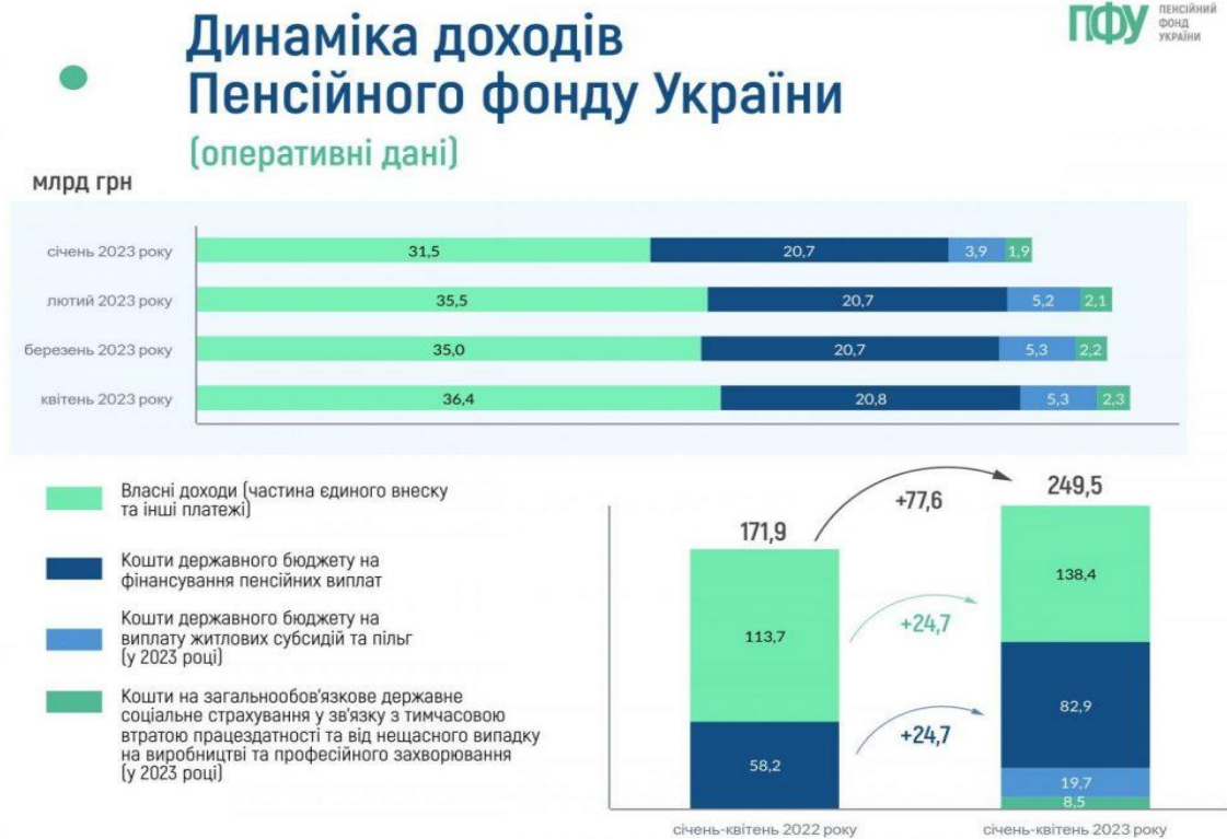
Рис. 2. Динаміка доходів Пенсійного фонду України у січні – квітні 2023 року [1]

За інформацією Пенсійного фонду України, у січні – квітні 2023 року до бюджету цієї установи з усіх джерел сумарно надійшло 249,5 млрд грн, з яких власні доходи склали 138,4 млрд грн (рис. 2).