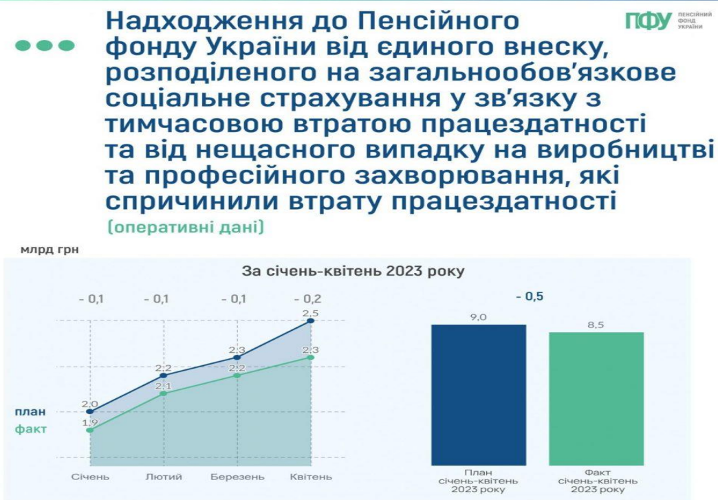
Рис. 4. Динаміка надходження до Пенсійного фонду України від єдиного внеску, розподіленого на загальнообов'язкове державне соціальне страхування, у січні – квітні 2023 року [4]