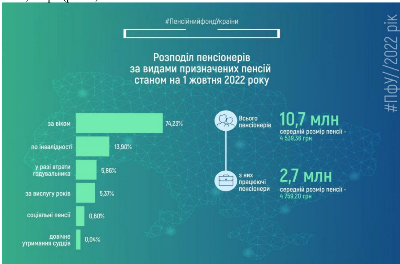
Рис. 1. Розподіл пенсіонерів в Україні за видами призначених пенсій станом на 1 жовтня 2022 року [4]

Так, за даними Пенсійного фонду України, станом на 1 жовтня 2022 року в Україні було зареєстровано 10,7 млн пенсіонерів, а середній розмір пенсії становив 4539,36 грн (рис. 1).