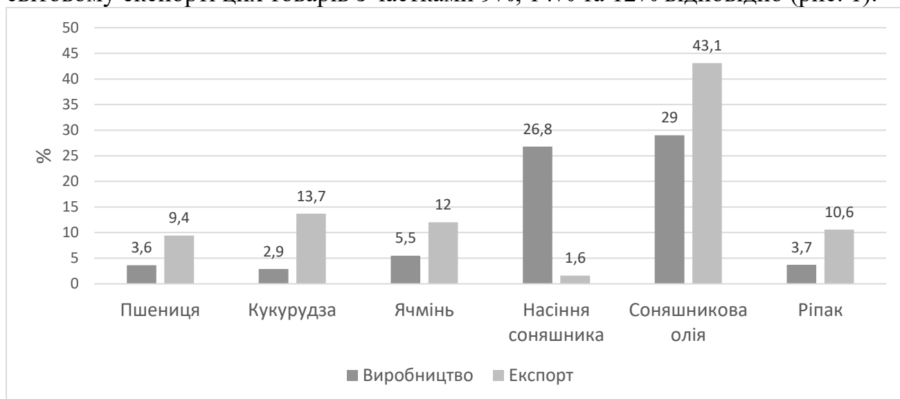
Рис. 1. Частка України у світовому виробництві та експорті деяких сільськогосподарських товарів в 2017-2021 рр., %

Останніми роками Україна була важливим виробником та експортером сільськогосподарської продукції у світових масштабах, зокрема зерна та рослинної олії. За 2017-2021 рр. Україна виробила близько 4% світового виробництва пшениці, 3% кукурудзи та 6% ячменю та займала вагому частку у світовому експорті цих товарів з частками 9%, 14% та 12% відповідно (рис. 1).