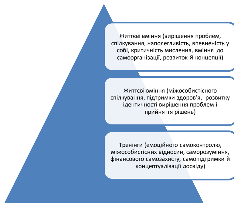
Рис. 3.1. Моделі розвитку соціальних умінь (автор- К.Роджерс)

Цікавим виявився підхід Карла Роджерса у сфері розвитку професійної підготовки консультантів, вчителів, менеджерів, а також їхньої психологічної підтримки (виокремлений у 60-х роках ХХ століття). Саме він на підвалинах гуманістичної психології започаткував «рух тренінгу соціальних і життєвих умінь (social / lifeskillstraining)». Автор зосередив увагу наукової спільноти на трьох моделях формування умінь відповідно до особливостей учасників тренінгу.