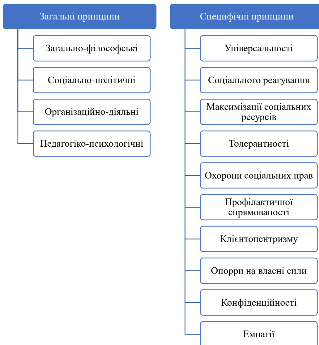
Рис. 1.1. Загальні та специфічні принципи СР

Організаційно-діяльні принципи. До даної групи принципів належать: «соціально-технологічна компетентність кадрів; функціональна визначеність; єдність прав і обов'язків; єдність повноважень та відповідальності; контроль та перевірка виконання» [17].