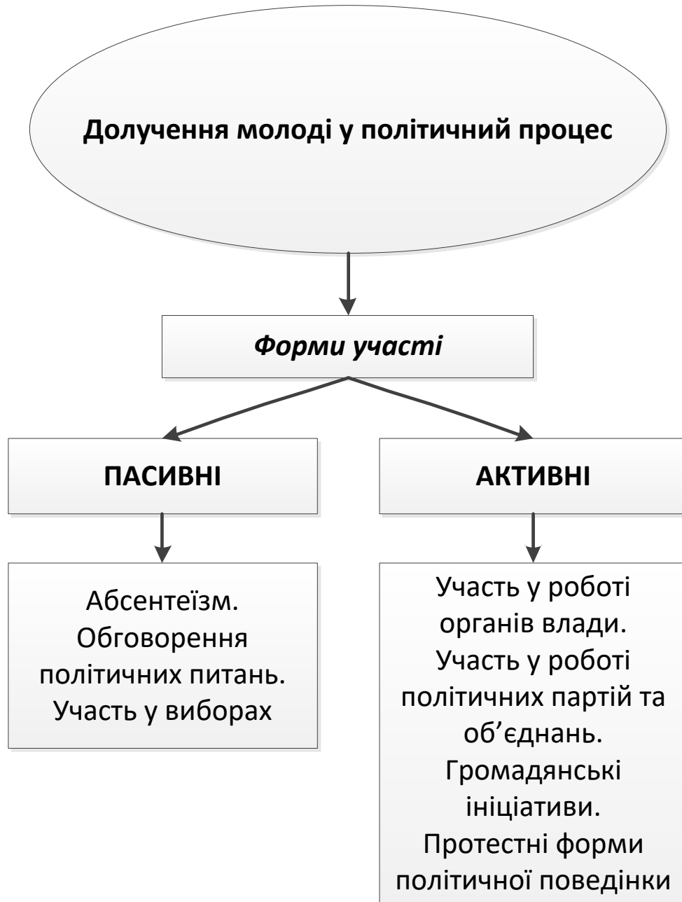
Рис. 2.2. Моделі реалізації політичного потенціалу молоді

довіри до політичної системи, зростання підтримки вкрай правих та вкрай лівих партій і навіть до бажання використати політичне насильство.