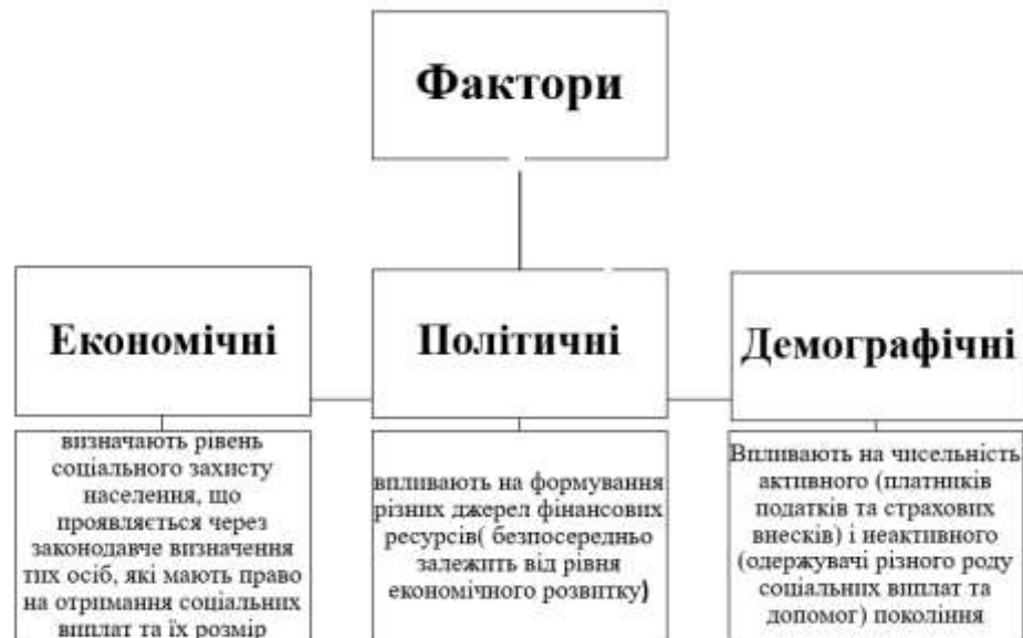
Рис 3.1 Фактори впливу на фінансову підтримку

охоплював усі аспекти цієї сфери. Такий акт дозволить систематизувати та узагальнити всі норми, що регулюють надання соціальних пільг, зробити процедуру надання пільг більш зрозумілою для громадян, забезпечити однакове застосування норм законодавства на всій території країни, усунути суперечності та прогалини в законодавстві.