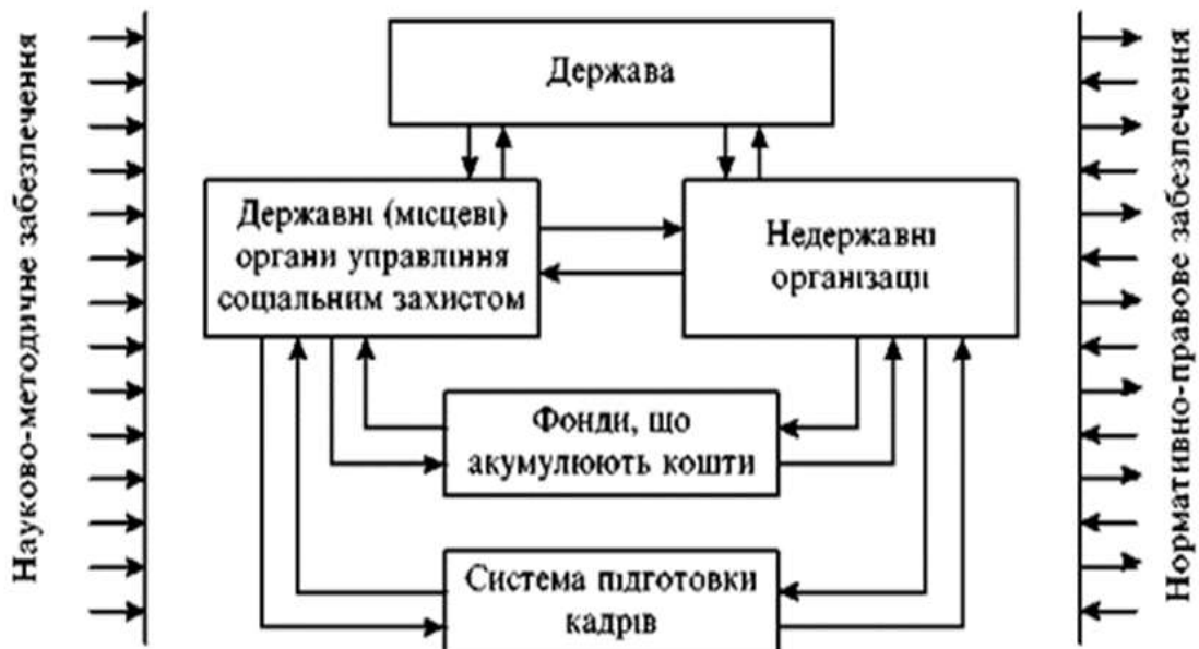
Рис. 1.2 Організаційно-правова структура системи соціального захисту населення.

Організаційно-правову структуру системи соціального захисту населення можна подати у наступному вигляді ( рис. 1.2):