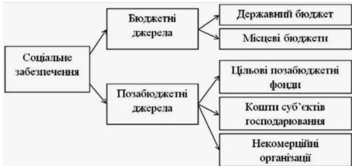
Рис. 1.3 Види джерел фінансування соціального забезпечення

Фінансування соціального забезпечення здійснюється за рахунок різних джерел, як бюджетних, так і позабюджетних. Різноманітність джерел фінансування соціального забезпечення можна побачити на рис. 1.3