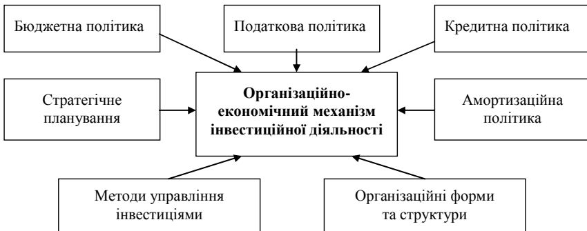
Рис. 1. Складники організаційно-економічного механізму інвестиційної діяльності харчових підприємств

На організаційно-економічний механізм інвестиційної діяльності харчових і переробних підприємств впливають багато макроекономічних та мікроекономічних чинників; галузевих і міжгалузевих факторів; регіональні й загальнодержавні особливості організації виробництва продуктів харчування. Крім того, на особливості його розвитку впливають чинники невизначеності та економічні ризики, що супроводжують діяльність харчових підприємств [6]. Вагому роль відіграють рівень менеджменту на підприємствах, ефективність операційної діяльності, необхідність або відсутність реструктуризації тощо.