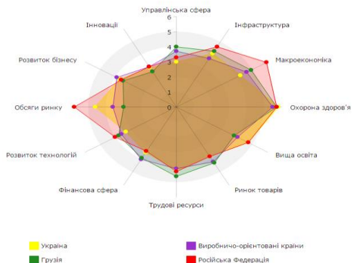
Рис. 4. Порівняння показників складових індексу конкурентоспроможності у 2013-2014 роках

Проведений нами як історичний, так і причинно-наслідковий аналіз конкурентоспроможності дозволив визначити, що економіка України володіє потенціалом щодо посилення позицій, проте все таки існує ще багато бар'єрів, які необхідно подолати на шляху до підвищення рівня конкурентних переваг на світовому ринку. Згідно із дослідженнями Всесвітнього економічного форуму, найбільшими перешкодами для України у питаннях ведення бізнесу є корупція, недосконале податкове законодавство, бюрократія, інфляція, політична нестабільність тощо. І саме боротьба з цими явищами повинна стати основним пріоритетом суспільно-політичних відносин в нашій країні.