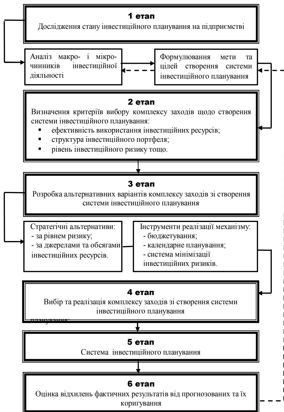
Рис. 2. Етапи реалізації механізму створення системи інвестиційного планування.

інвестиційних процесів та дозволить суб'єкту господарювання вчасно виявити зміни мікро- та макрочинників інвестиційної діяльності, розробити та реалізувати комплекс заходів щодо її створення. Етапи реалізації механізму створення системи інвестиційного планування наведено на рис. 2.