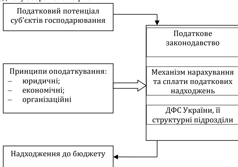
Рис. 1. Модель організації податкових надходжень до бюджетів усіх рівнів*

Побудова механізму формування податкових надходжень повинна супроводжуватись дотриманням певних принципів, за допомогою яких поряд із забезпеченням зростання економіки здійснювалося би стимулювання розвитку виробництва та забезпечувалась співпраця платників податків із податковими органами. Графічно місце принципів оподаткування у процесі формування податкових надходжень до бюджету зображено на рис. 1.