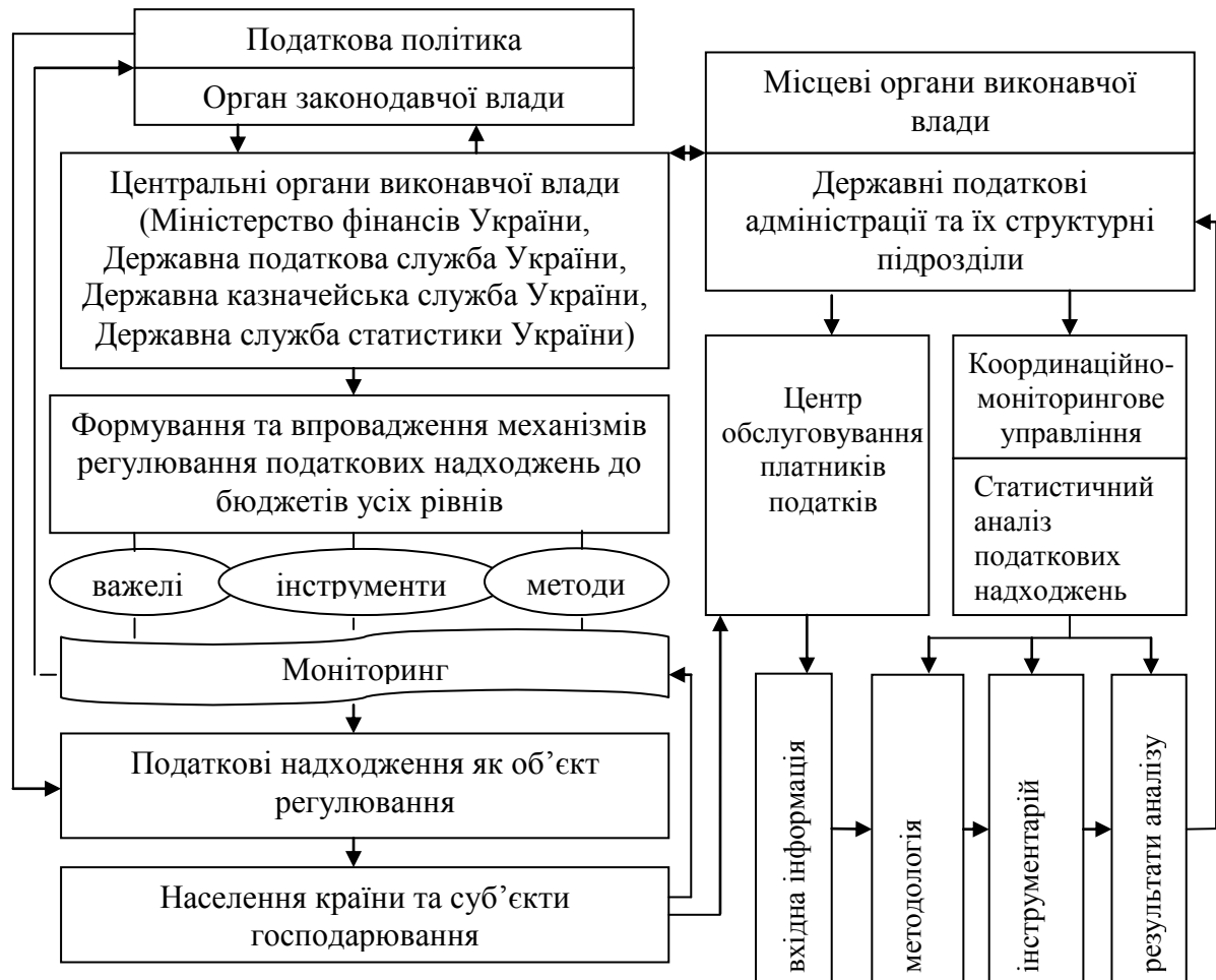
Рис. 1. Роль статистичного аналізу у процесі державного регулювання податкових надходжень

Визначено сутність податків, як об'єкта статистичного аналізу, їх функції, роль у якості фінансового регулятора економіки країни. Обґрунтовано необхідність повсякчасного проведення статистичного аналізу податкових надходжень до бюджету та оновлення методики його проведення (рис. 1).