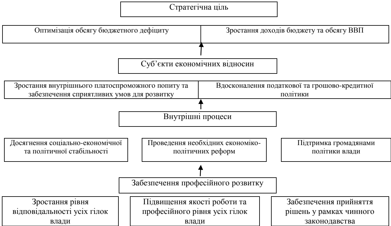
Рис. 2. Стратегічна карта системи управління бюджетним дефіцитом

Зазначено, що для формування системи управління бюджетним дефіцитом важливо виявити економіко-математичні залежності між ним і такими макроекономічними показниками як державний борг та ВВП (табл.2).