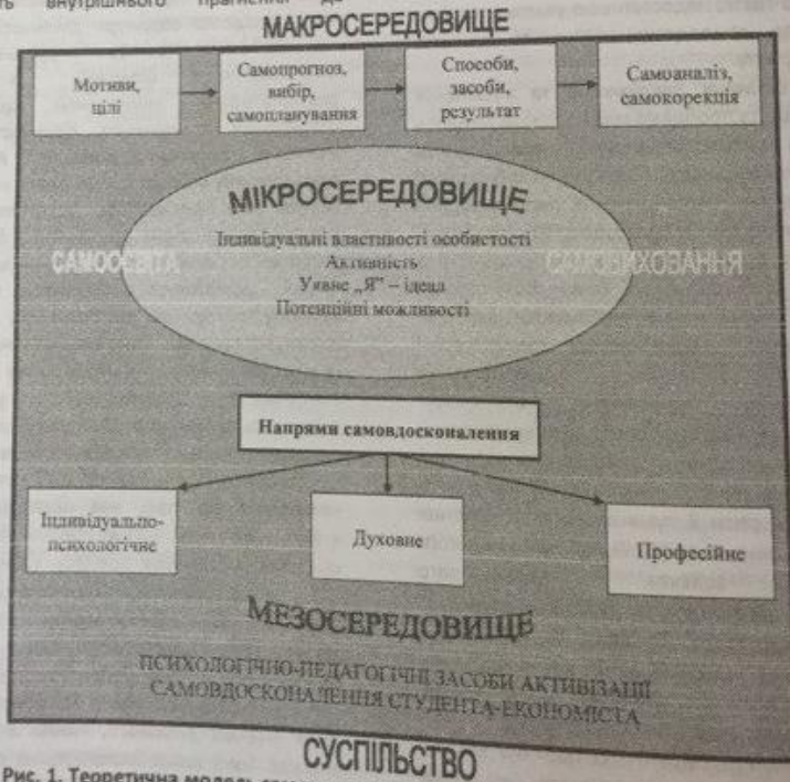
Рис. 1. Теоретична модель самовдосконалення особистості студента-економіста

самовдосконалення: характеризує практичний аспект готовності, містить уміння, необхідні для успішного удосконалення (уміння ефективно використовувати вільний час, виключатися з діяльності із самовдосконалення, планувати, організувати, контролювати свої дії); характеризує ефективний аспект готовності до самовдосконалення, включає емоційне ставлення до процесу самовдосконалення, наявність волевих рис особистості, які сприяють самовдосконаленню: наполегливість, рішучість, самодисциплінованість, цілеспрямованість, уміння контролювати себе та планувати діяльність, визначається емоційним ставленням студента до процесу самовдосконалення, здатністю вихованця робити свідомий вибір, нести відповідальність за власні дії; відображає рівень сформованості саморегуляції, сформованість особистісних якостей, спрямованих на самовдосконалення. Серед останніх – креативність, емоційна активність, здатність до наукового пошуку, альтернативність і дивергентність мислення тощо. Мікросередовище включає також і потенційні можливості майбутнього фахівця, можливість особистісного росту людини і її самостійне прагнення наблизитися до певного ідеалу.