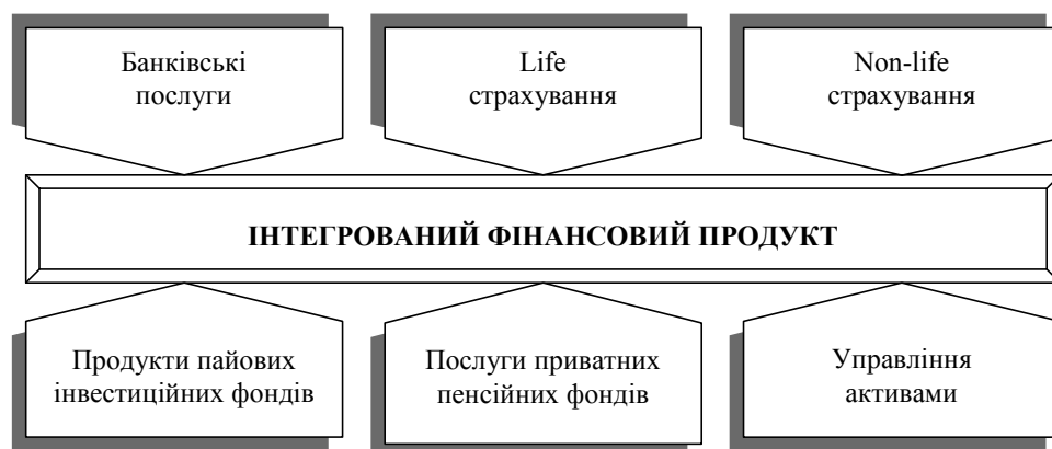
Рис. 3. Типовий комплекс послуг, який надають клієнтам фінансові конгломерати [7, 126]

З урахуванням банкоцентричного характеру інвестиційного ринку України підвищений інтерес міжнародних інвесторів ви-